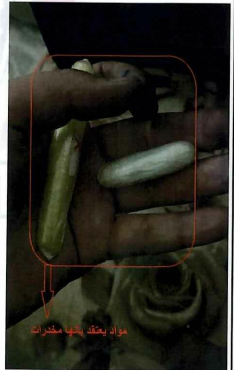
مواد يعتقد بانها مخدرات

نوع الهاتف ونوع كاميرة الهاتف موضوع الكتاب