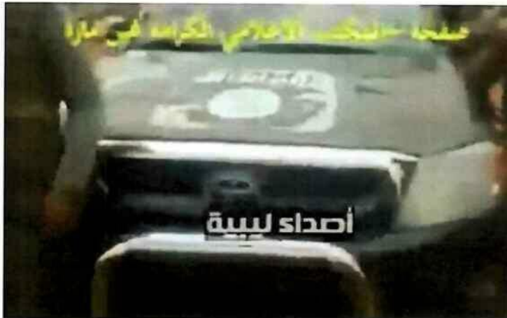
صور لسيارة نوع (تويوتا) دفع رباعي عليها ملصق لشعار التنظيم الإرهابي المذكور.

اعتماد رئيس قسم المعلوماتية والاتصالات بمكتب النائب العام