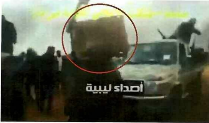
صورة لشخص يرتدي زي عسكري يحمل حقيبة لون (بييج) معلقاً بأنها مواد متفجرة تم غنمها من التنظيم الإرهابي المذكور.