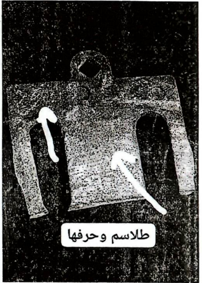
طلاسم و حرفها