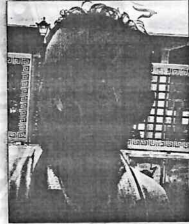
(صورة من التسجيل المرفق)

• المرفقات: بطاقة معلومات لبياناته التفصيلية.