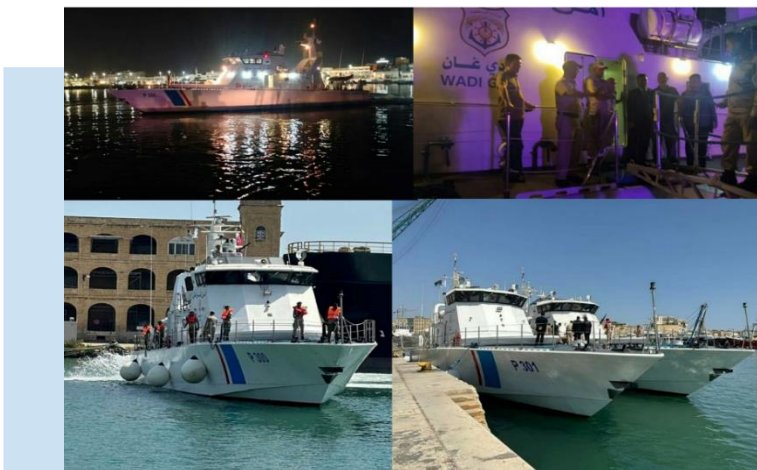
(NC) Partenza e arrivo delle Le Unità

(NC) COMMENTO: il GUN vorrebbe il nuovo Dispositivo completamente sotto il proprio controllo anche se non è noto chi sarà al comando della nuova Unità. La nuova organizzazione di sicurezza potrebbe entrare in contrapposizione con i vari gruppi già presenti nella Regione occidentale ed essere origine di tensioni tra le parti. Fonti di opposizione al GUN accusano la formazione dell'Organizzazione di sicurezza come scelta individualista del Premier in quanto "asservita ai bisogni personali e familiari dello stesso DBEIBAH".