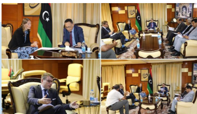
(NC) L'incontro tra Katherine WILD e Mohammed

Dipartimento per il Commercio Estero e il Capo del Dipartimento per la Cooperazione Internazionale del Ministero, hanno discusso del processo per il rientro delle aziende britanniche e la ripresa dei progetti di investimento appaltati in LIBIA. AL-HUWEIJ ha sottolineato l'importanza di tenere una riunione del Comitato di follow-up libico-britannico, con l'obiettivo di sviluppare relazioni bilaterali e cooperazione nei settori del commercio e degli investimenti, oltre a rafforzare il ruolo del Consiglio libico-britannico degli imprenditori, organizzare le attività economiche e commerciali e stabilire un partenariato tra i settori privati dei due Paesi. WILDE ha espresso il desiderio del REGNO UNITO di rafforzare la cooperazione con la LIBIA anche nei settori dei trasporti, delle zone franche e delle energie rinnovabili. Inoltre, il Vice Ambasciatore, ha evidenziato la volontà delle aziende britanniche di riprendere le loro attività in LIBIA e di contribuire alla ricostruzione e alla partecipazione del settore privato locale nella realizzazione di progetti di investimento. AL-HUWEIJ e WILD, hanno, inoltre, concordato