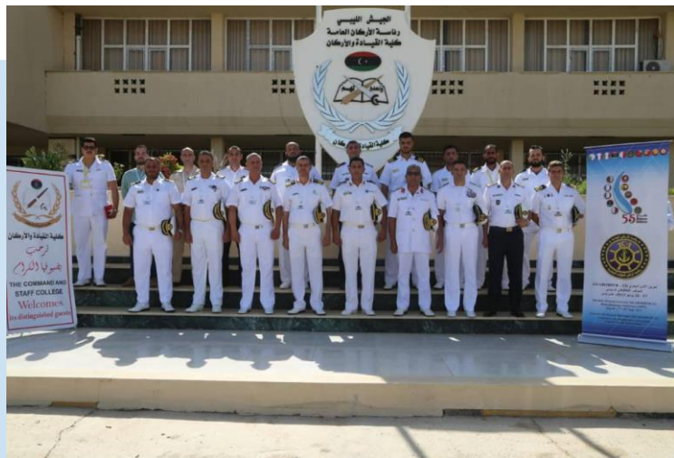
(NC) Rappresentanti Comitato

(NC) Nei giorni 18 e 19 luglio, nell'ambito dell'attuazione delle attività libiche del Piano di lavoro multilaterale, la capitale TRIPOLI, ha ospitato una riunione dell'Iniziativa 5+5 2 Difesa per la preparazione della seconda fase dell'esercitazione per la sicurezza marittima denominata SEABORDER-23 che dovrebbe svolgersi nel mese di settembre