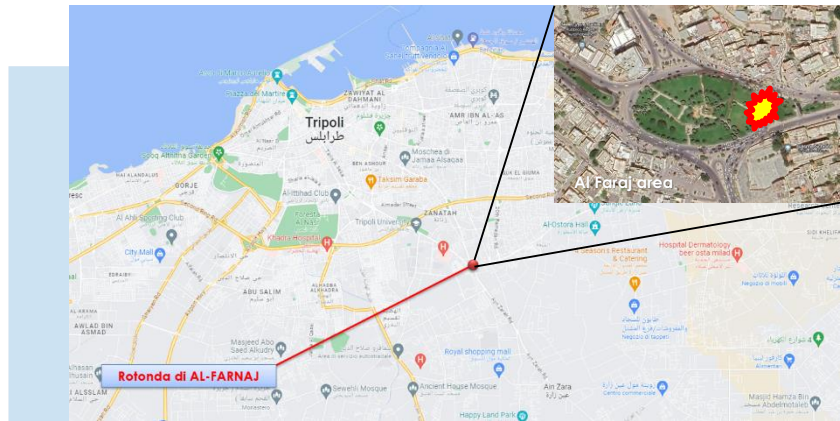
(NC) Rotonda di AL-FARNAJ

(NC) Il 20 luglio, nel corso delle ore serali, l'area del quartiere di AL FERNAJ a TRIPOLI, è stata interessata da un conflitto a fuoco tra assetti della Brigata 444 e della Polizia giudiziaria in organico alla forza RADAA. A un convoglio appartenente alle Forze RADAA,