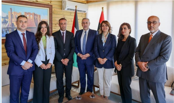
(NC) AL MANQOUSH e la Delegazione Palestinese

✓ (NC) Il 20 luglio, il Ministro degli Affari Esteri e della Cooperazione Internazionale, Najla AL-MANQOUSH, ha accolto una delegazione del Ministero degli Esteri palestinese, guidata dal Viceministro degli Esteri palestinese, Imad ZUHAIRI, per