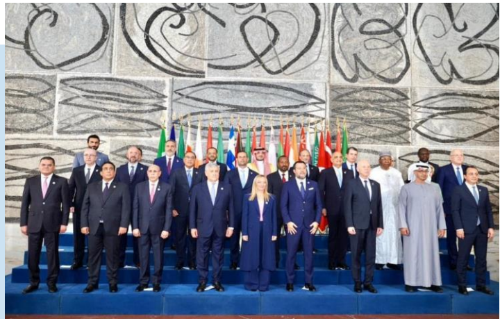
(NC) Rappresentati dei Paesi partecipanti

(NC) Il 23 luglio, il Presidente del Consiglio Presidenziale libico, Mohammed AL-MENFI, accompagnato dal Primo Ministro del GUN, Abdul Hamid DBEIBAH, ha partecipato a ROMA, alla conferenza internazionale sullo sviluppo e l'immigrazione. Alla Conferenza, hanno preso parte i Leader dei Paesi del Bacino del