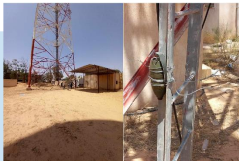
(NC) Ritrovamento IED

Nella Regione Occidentale nell'area ZAWIYA, continua a crescere il sentimento anti-GUN. Nei giorni scorsi, nella zona tra BEIR TERFAS e ZAWIYA, le Forze di sicurezza del GUN, hanno rinvenuto un ordigno esplosivo improvvisato (IED) piazzato su un traliccio utilizzato per trasmettere segnali ai veicoli aerei senza pilota (UAV) gestiti dal GUN, sventando di fatto un atto di sabotaggio volto a