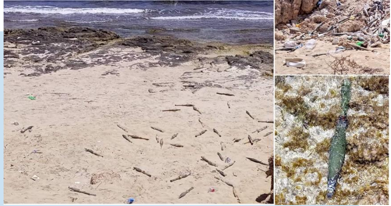
(NC) Il rinvenimento di razzi RPG

(NC) Il 20 luglio, i Servizi di Sicurezza della sezione di MISURATA , impegnati in un normale servizio di controllo del territorio nell'ambito dell'azione di contrasto alla criminalità, hanno rinvenuto su una spiaggia nel distretto di YEDDIR, un'ingente quantità di munizionamento di RPG.