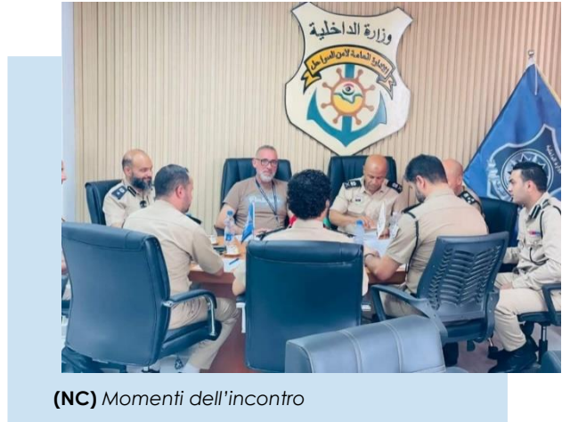
(NC) Momenti dell'incontro