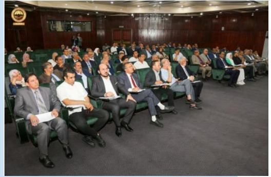
(NC) Camera dei Rappresentanti di BENGASI