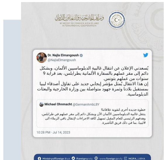
(NC) Il messaggio su Twitter