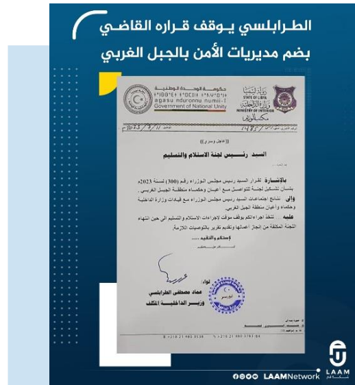
(NC) Il decreto di sospensione di TRABELSI

(NC) COMMENTO: l'apparente insistenza di TRABELSI a portare avanti la realizzazione di strutturare le Direzioni della Sicurezza, trascurando gli ordini di DBEIBAH e le proteste dei Sindaci e dei Notabili locali, avrebbe potuto alimentare a breve termine, tensioni tra TRABELSI e DBEIBAH. Si evidenzia, a tal proposito, come il Primo Ministro del GUN aveva recentemente deciso di rinviare la realizzazione della riorganizzazione sancita da TRABELSI dopo che i sindaci della regione montuosa occidentale, per protesta, avevano interrotto i rapporti con il GUN.