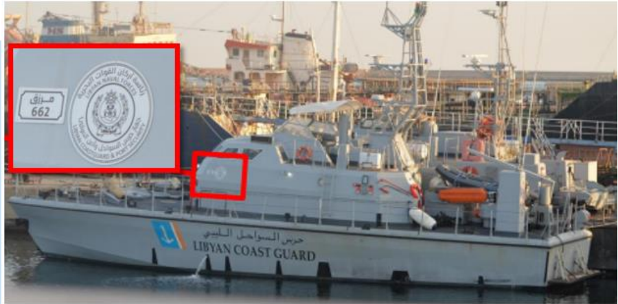
(NC) La Motovedetta classe Currubia "MURZUQ" 662

(NC) EVENTO: il 15 luglio, durante la mattinata, presso la Base Navale Militare di ABU-SITTAH a TRIPOLI, è stata osservata una delle due nuove Unità navali classe Currubia