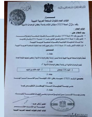
(NC) Decreto del LNA

(NC) EVENTO: il 10 luglio, Il Comandante del LNA, Feldmaresciallo Khalifa HAFTAR, con la delibera nr. 220/2023 del 7 luglio 2023, ha decretato la formazione di una nuova Divisione chiamata "Dipartimento delle Unità di Sicurezza", affidando il comando a suo figlio Khaled HAFTAR. La nuova struttura organizzativa includerà la 106ª Brigata Majhafil e il Battaglione Khaled bin AL-WALEED.