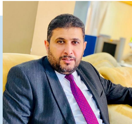
(NC) Faraj BOUMTARI

(NC) EVENTO: la notte dell'11 luglio, l'Agenzia per la Sicurezza Interna (ISA), ha tratto in arresto, al suo arrivo all'Aeroporto Internazionale Mitiga di TRIPOLI, l'ex Ministro delle Finanze del Governo di Accordo Nazionale (GNA), Faraj BOUMTARI. Al momento non è chiaro chi abbia ordinato l'arresto; indicazioni non confermate riportano che sia stato facilitato dal Governatore della Banca Centrale Libica (CBL), Al-Siddik AL-KABIR, oppure, secondo fonti locali non confermate, l'ordine potrebbe essere stato dato direttamente dal Primo Ministro del GUN, Abdul Hamid DBEIBAH.