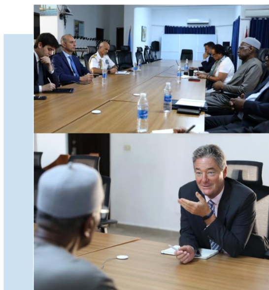
(NC) Gli incontri con ALBERINI e OHNMACHT

dell'importanza di avere un quadro giuridico consensuale e applicabile per le elezioni nonché della necessità di evitare qualsiasi passo unilaterale. BATHILY ha anche affermato che spetta alle parti interessate libiche lavorare insieme per trovare soluzioni alla crisi basate sul consenso. Entrambi i colloqui hanno evidenziato un accordo comune sull'importanza del raggiungimento di un consenso da parte di tutti i partiti libici sulla tabella di marcia verso le elezioni. BATHILY e gli ambasciatori hanno concordato come la stabilità della LIBIA sia fondamentale per la prosperità dei suoi cittadini e per mantenere la pace e la sicurezza nei Paesi vicini.