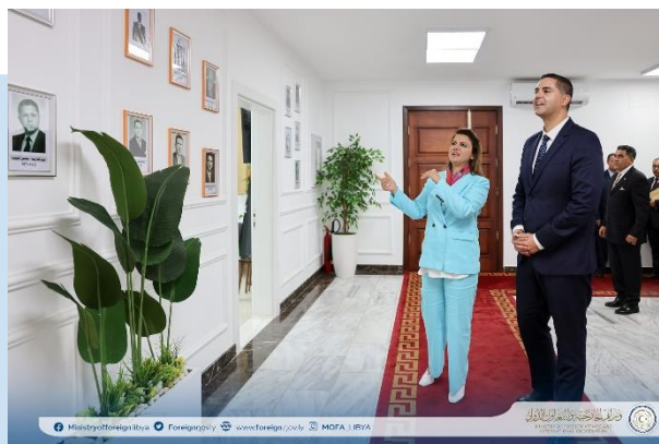
(NC) MANGOUSH e BORG

dei due Paesi per sviluppare le storiche relazioni bilaterali tra LIBIA e MALTA, in vari ambiti. Le due parti hanno affermato il loro impegno a rafforzare una fruttuosa cooperazione e portarla a livelli più completi, al servizio delle ambizioni dei due Paesi e dei popoli, in particolare nei settori dell'economia, degli investimenti, delle energie rinnovabili e della gestione del fascicolo sull'immigrazione clandestina. Inoltre, i due Ministri, hanno trattato gli sviluppi della situazione locale in LIBIA e gli sforzi internazionali, volti a rafforzare la sicurezza e la stabilità nel Paese, al fine di realizzare le aspirazioni del popolo libico, oltre alle questioni regionali e internazionali di interesse comune.