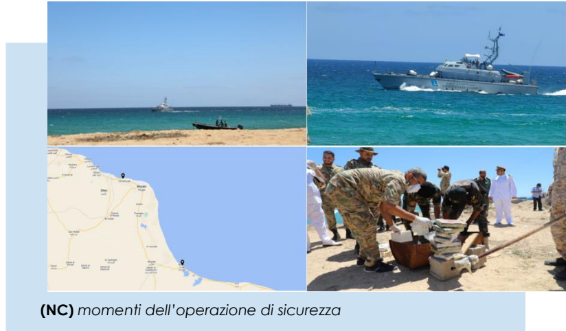
(NC) momenti dell'operazione di sicurezza

(NC) EVENTO – (MISURATA): il 16 luglio, la Libyan Navy Coast Guard (LNCG) del GUN, ha condotto operazioni di sicurezza con pattugliamenti nel Golfo di SIRTE, nell'area marittima compresa tra BUERAT, MISURATA e DAFINIYAH, mediante