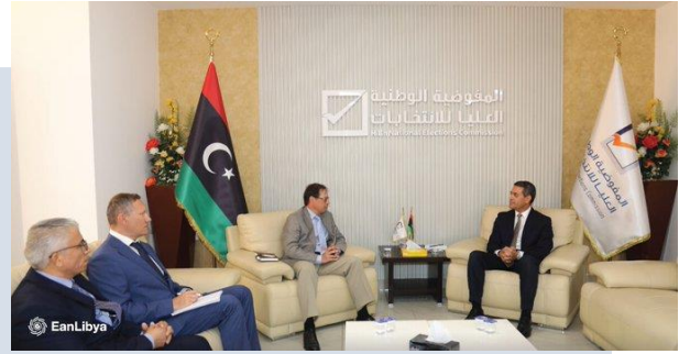
(NC) Momenti della riunione

degli ultimi sviluppi nei processi elettorali e dei preparativi della Commissione per la loro attuazione affermando che supporto e competenza possono essere forniti nel campo della gestione e dell'attuazione delle elezioni; inoltre, è stato rilevato come siano stati esaminati i modi per sostenere le proposte e gli sforzi per garantirne il successo delle elezioni stesse in conformità con gli standard internazionali. AGANIN ha confermato il sostegno del suo Paese agli sforzi della Commissione per ottenere elezioni libere e credibili che riflettano la volontà dell'elettore libico e le sue aspirazioni di pace e stabilità.