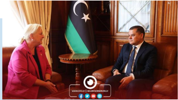
(NC) L'incontro tra SAVARD e DBEIBAH

significativo. L'incontro ha toccato aspetti di cooperazione anche nei settori dell'istruzione e della salute, oltre a creare interventi finalizzati allo sviluppo economico e sociale. Da parte sua, l'Ambasciatore canadese ha confermato come il suo team stia lavorando per avere una presenza permanente in LIBIA e per attivare aspetti di cooperazione tra i due Paesi. Ha inoltre ribadito il sostegno agli sforzi internazionali per ottenere le elezioni in LIBIA.