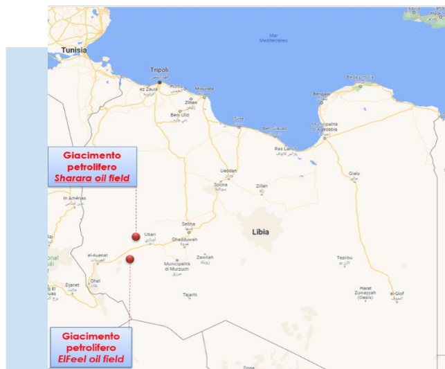
(NC) I giacimenti EL-FEEL e SHARARA