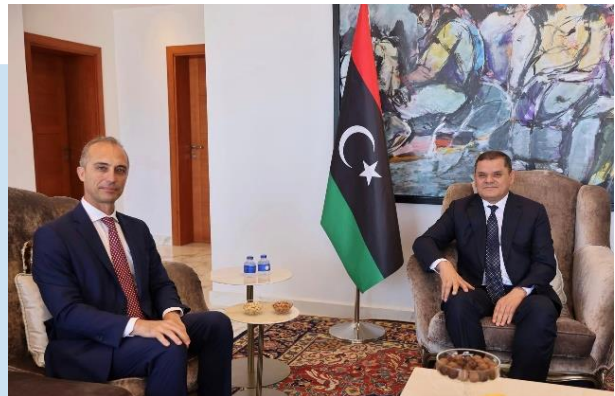
(NC) ALBERINI e DBEIBAH

della sua recente visita a ROMA, in occasione del Forum Economico Italo-Libico, e di unificare gli sforzi congiunti nella lotta all'immigrazione clandestina. ALBERINI ha riferito al Presidente del Consiglio l'impegno dell'Ambasciata italiana per aumentare il numero dei visti, per integrare gli sforzi dei due Paesi nell'apertura dello spazio aereo, che sarà avviata il prossimo settembre, e per aumentare la cooperazione tecnica nei vari settori governativi. L'Ambasciatore italiano ha, inoltre, affermato il sostegno dell'ITALIA a tutti gli sforzi internazionali per sostenere lo svolgimento di elezioni regolari.