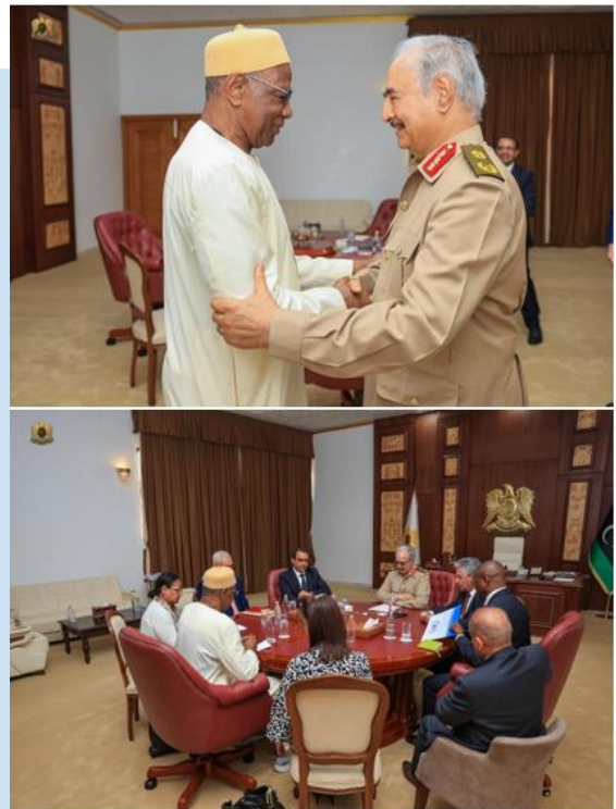
(NC) Momenti della riunione

(NC) EVENTO: l'11 luglio, Il Comandante del LNA, Feldmaresciallo Khalifa HAFTAR, ha accolto a BENGASI una delegazione UNSMIL guidata dal SRSG, Abdoulaye BATHILY. L'incontro ha comportato discussioni degli ultimi sviluppi politici sulla scena libica. Le parti, inoltre, hanno concordato sulla necessità di affrontare le questioni controverse nelle leggi elettorali, sottolineando l'importanza della partecipazione e dell'accettazione di tutte le istituzioni libiche pertinenti e dei partiti chiave per raggiungere una soluzione politica che apra la strada allo svolgimento di elezioni inclusive e di successo che soddisfino le aspirazioni del popolo libico.