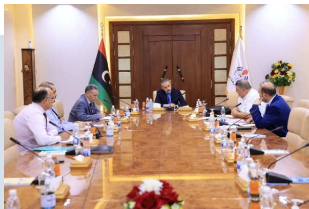
(NC) La riunione

(NC) EVENTO: Il 10 luglio, Il Presidente del Consiglio di Amministrazione della NOC, Farhat BENGDAH, ha incontrato presso il suo ufficio a TRIPOLI, il Comitato per gli investimenti NOC. L'incontro si è concentrato sull'analisi delle opportunità di investimento disponibili grazie alla maggiore stabilità della produzione di petrolio dopo la revoca della forza maggiore, sulle operazioni di esplorazione