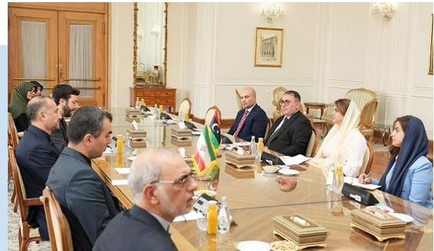
(NC) Momenti della riunione

(NC) Il 25 luglio, il Ministro degli Esteri iraniano Hossein Amir ABDOLLAHIAN, ha ricevuto presso la sede del Ministero degli Esteri a TEHERAN, Il Ministro degli Affari Esteri del GUN, Najla AL-MANQOUSH insieme ad una Delegazione libica. Le parti hanno tenuto una serie di colloqui, come il processo per ristabilire la