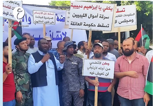
(NC) Momenti della manifestazione

AL-ZAWY ha riferito in alcuni post sui social media che le proteste contavano sulla copertura politica del capo dell'Alto Consiglio di Stato (HCS), Khalid AL MISHRI ed avrebbero avuto il coinvolgimento di altri attori in supporto che includevano i comandanti di gruppi armati di ZAWIYAH e ZINTAN. Giovedì, le manifestazioni si sono svolte solo nella