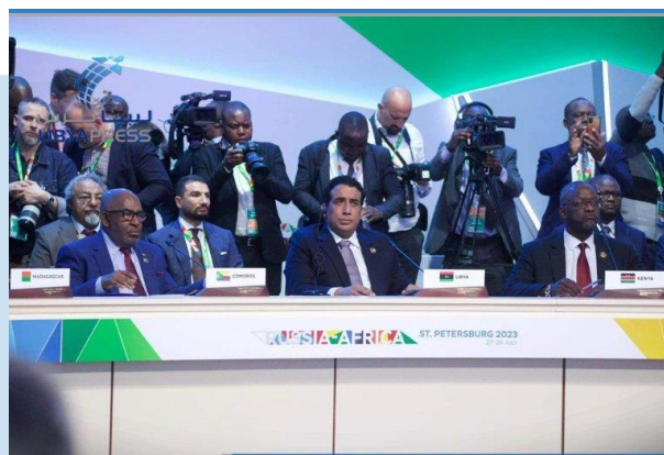
(NC) AL-MENFI al Convegno RUSSIA-AFRICA

importanti del CP rientrano la libera circolazione dei libici nel Paese, unificazione delle Istituzioni libiche ed in particolare di quelle militari con l'avvio dei lavori per stabilire una forza congiunta formata da tutte le componenti delle forze/unità militari libiche.