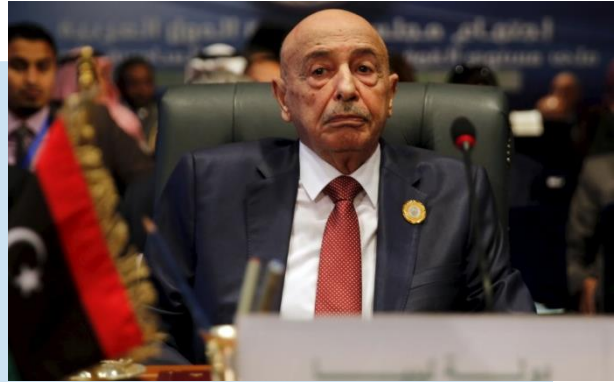
(NC) Presidente del CdR Aqila SALEH

l'approvazione di 15 membri della CdR e 10 dell'Alto Consiglio di Stato (ASC). SALEH ha confermato che il Governo sarà un "mini-governo" unificato, che supervisionerà il percorso elettorale.