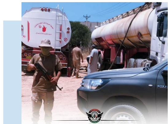
(NC) Momenti del sequestro

(NC) COMMENTO: il contrabbando di derivati del petrolio è un fenomeno diffuso nel Paese ed è ritenuto dalle stesse autorità libiche tra i principali fenomeni criminali portati a danno dell'economia nazionale.