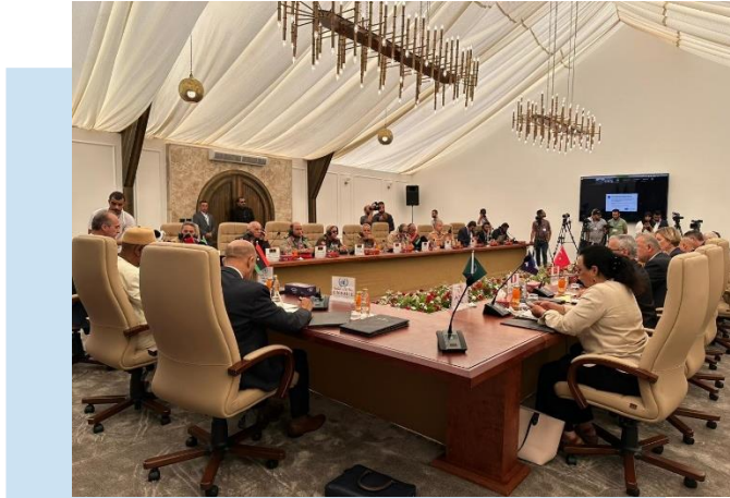
(NC) Momenti della riunione