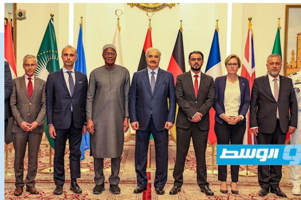
(NC) Partecipanti all'incontro