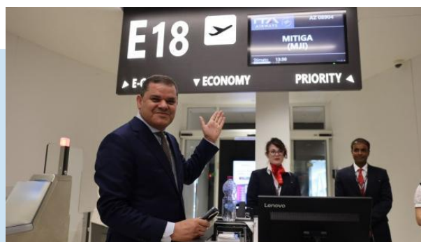
(NC) DBEIBAH presso l'aeroporto di Fiumicino

Compagnia italiana ITA Airways , (in via sperimentale dopo una pausa durata circa dieci anni in ragione del divieto 3 di utilizzo dello spazio aereo all'Aviazione libica), è partito dall'aeroporto Leonardo da Vinci di Fiumicino (ROMA) intorno alle 13:30, ed è atterrato all'aeroporto internazionale Mitiga di TRIPOLI intorno alle 14:45.