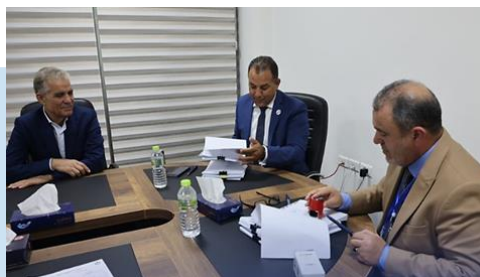
(NC) Momenti della riunione

(NC) COMMENTO: Questo tipo di contratto è il primo del suo genere per la LIBIA. La collaborazione della NOC con società internazionali, rappresenta un passaggio significativo per migliorare lo sviluppo petrolifero libico, nonché un passo importante nell'attuazione del progetto della NOC per aumentare la produzione di petrolio e migliorare l'efficienza operativa.