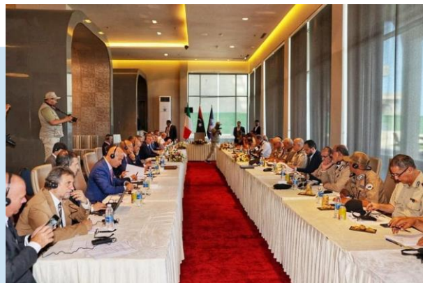
(NC) Momenti della riunione

Dipartimento Centrale delle Migrazioni e Polizia di Frontiera per la parte italiana, hanno partecipato i Funzionari del Ministero dell'Interno e Comandanti della Guardia di Frontiera e della Guardia Costiera presso il Ministero della Difesa. Le parti hanno discusso diversi dossier: