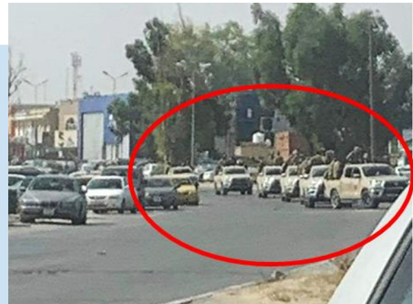
(NC) Convoglio Brigata 444