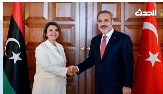
(NC) MANGOUSH e FIDAN

(NC) Il 26 luglio, Il Ministro degli Affari Esteri e del GUN, Najla MANGOUSH, ha incontrato ad ANKARA, in TURCHIA, l'omologo turco Hakan FIDAN. L'incontro è stato incentrato sulle relazioni bilaterali, direzione della cooperazione e sui modi per rafforzarla in vari settori, nonché sugli "sforzi per sostenere la stabilità della Libia".