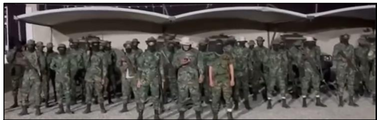
(NC) Gruppo armato durante dichiarazioni anti-turche

Secondo le dichiarazioni del portavoce/leader: "lo Stato turco si è spinto oltre i limiti nel controllo di importanti siti in LIBIA, occupando la base di AL-WATIYA (base aerea di Okba ibn Nafi), il porto di SIDI BILAL (porto di TRIPOLI) ed ultimo il porto di AL-KHUMS".