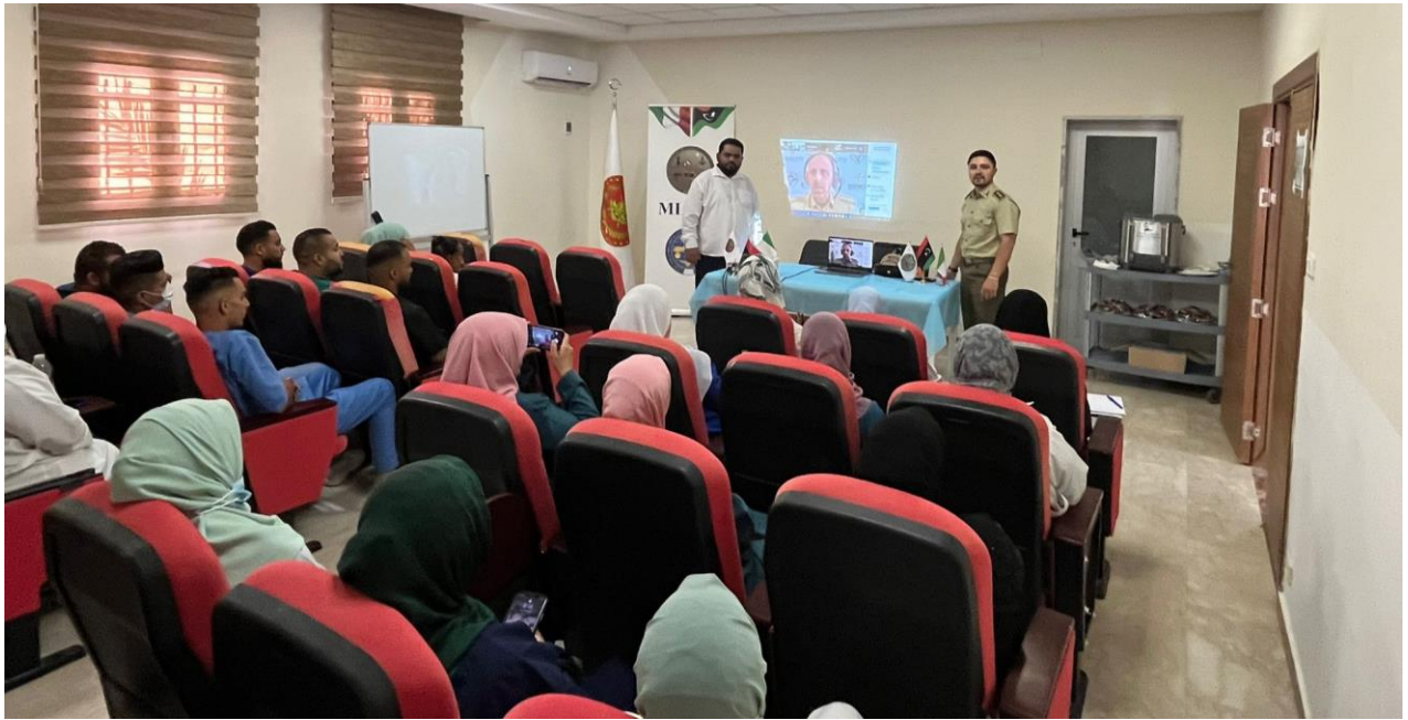
Fig. 3. Operatori sanitari dell'Ospedale di Tripoli, in diretta webinar, durante la prima edizione della Masterclass sul "Management sanitario e l'informatizzazione delle procedure in ambiente ospedaliero". TRIPOLI, JUN23.