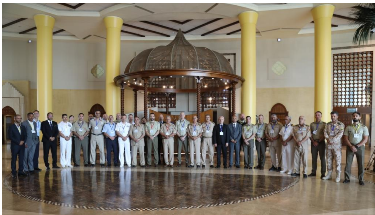
Fig. 2. I membri del Comitato Misto di Cooperazione ITALIA-LIBIA nel corso della 1^ Riunione 2023. TRIPOLI, JUN23.