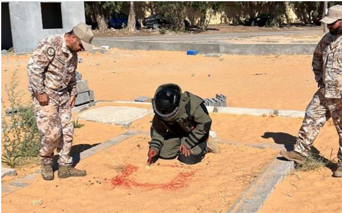
Fig. 4. Frequentatore del Corso "Explosive Hazard Search and Recognition – LY/ARMY/09" durante un esercizio di ricerca degli ordigni esplosivi TRIPOLI, JUN23.