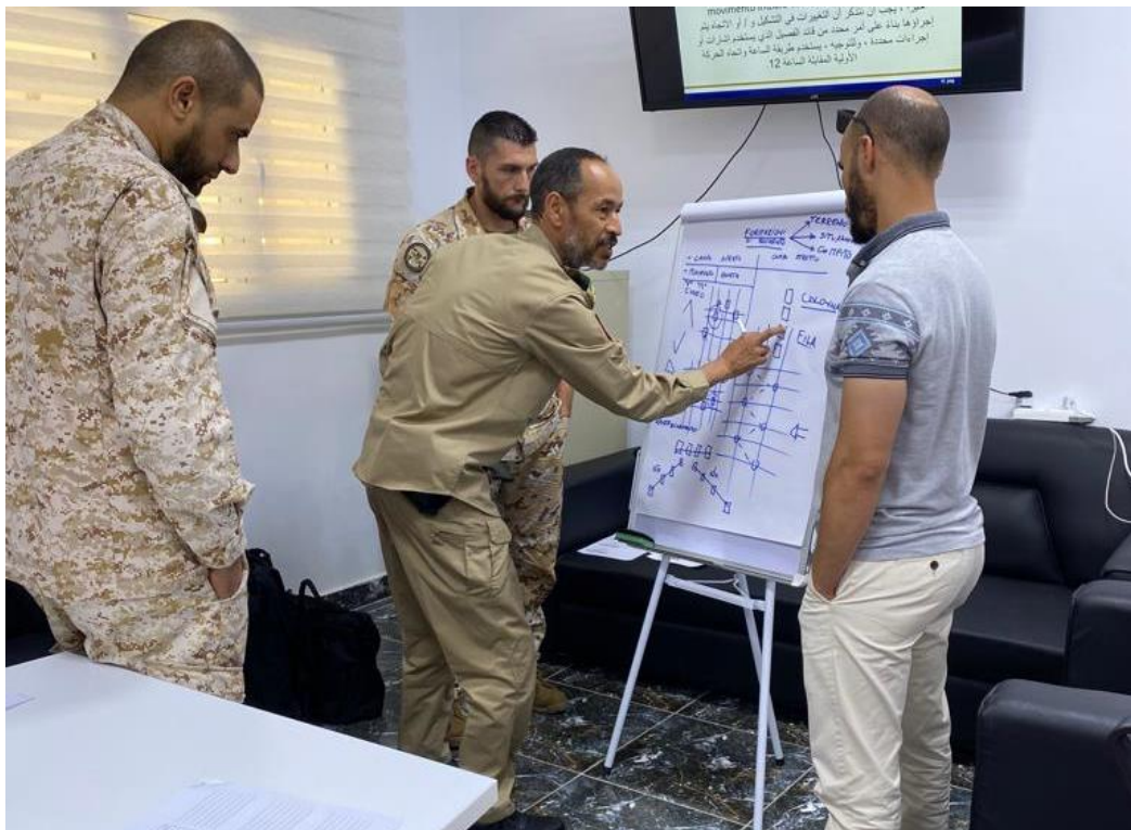
Fig. 6. I frequentatori del corso “Reconnaissance and Patrol Activities Training for Commanders – LY/ARMY/24” durante la lezione sulle formazioni di movimento delle Unità motorizzate. TRIPOLI, JUN23.