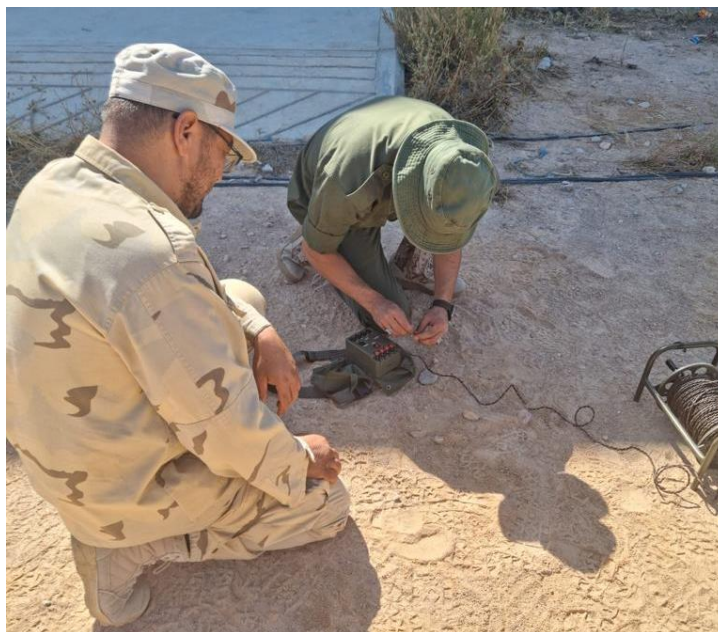
Fig. 8. Frequentatori del corso “Safe Procedures - LY/ARMY/18” durante un esercizio di distruzione in sito di una mina antiuomo attraverso l’uso di detonatore elettrico. MISURATA, JUN23.