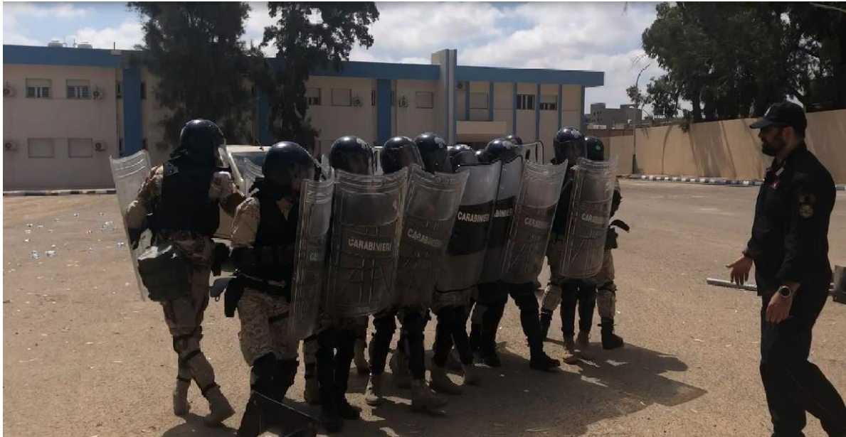
Fig. 5. Esercitazione finale del corso “Crowd and Riot Control”. I frequentatori a seguito della carica risolutiva hanno ripiegato e sono in attesa di riprendere il movimento a bordo dei mezzi. TRIPOLI, JUN23.