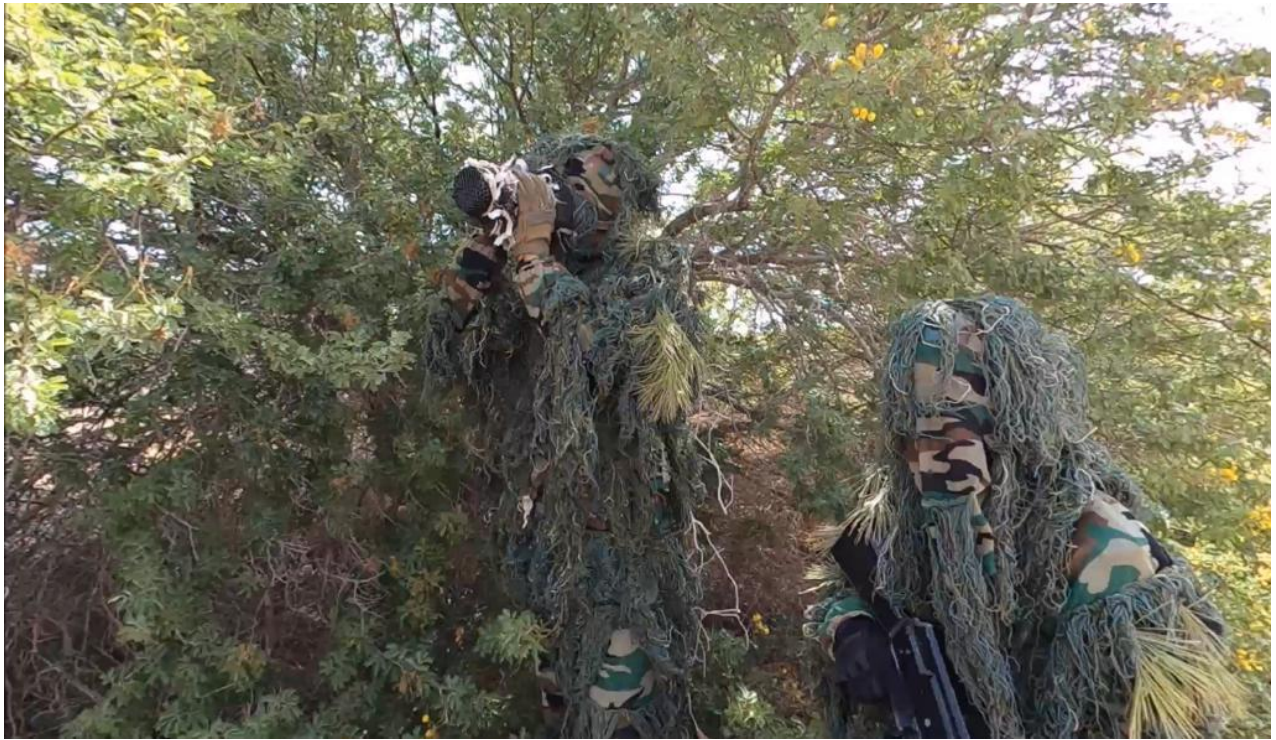
Fig. 9. Esercizio di osservazione occulta durante una fase del Corso “Company Intelligence Support Team Course (COIST) Advanced Infantry Course – LY/ARMY/28”. MISURATA, JUN23.