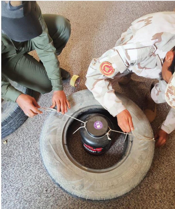
Fig. 7. Frequentatori del corso “Hook&Line – LY/ARMY/17” durante un esercizio di rimozione ordigno tramite la tiranteria. MISURATA, JUN23.