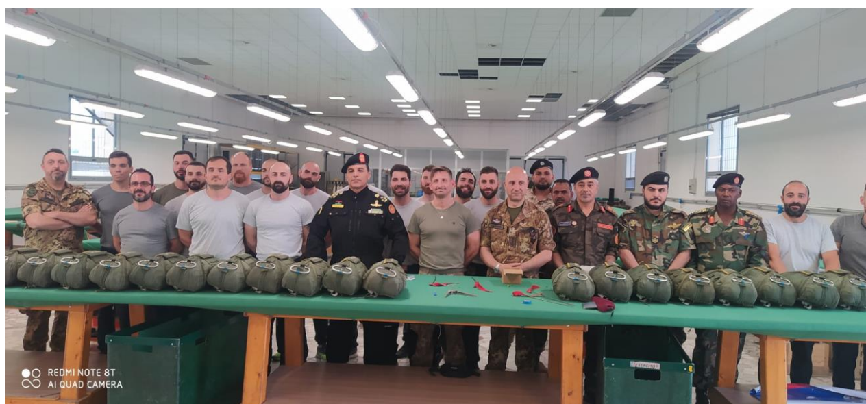
Fig. 1. Delegazione libica in visita presso il Centro Addestramento Paracadutismo dell'EI. PISA, JUN23.