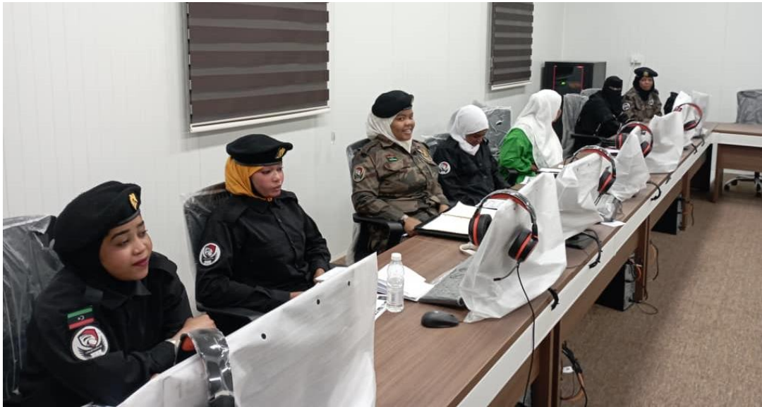
Fig. 11. Frequentatrici del Corso base di lingua italiana svolto a favore del personale femminile della Counter Terrorism Force. MISURATA, JUN23.