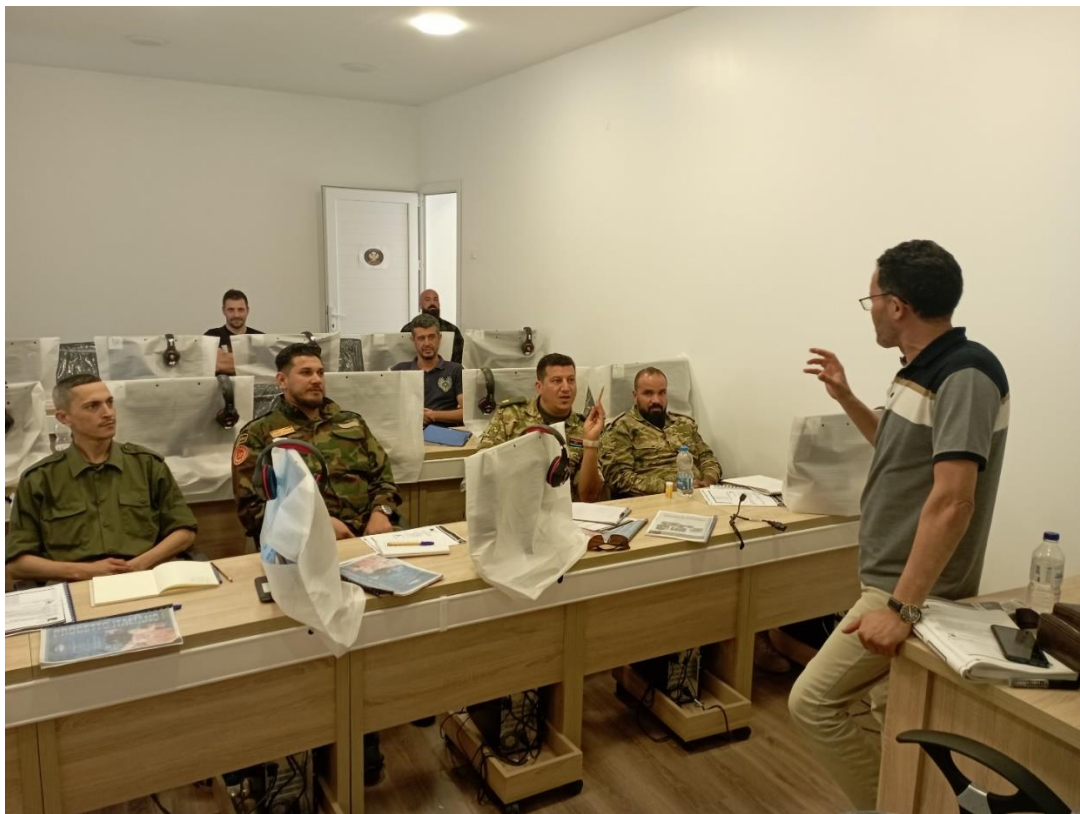
Fig. 12. Personale della Regionale Centrale di MISURATA durante le lezioni del corso avanzato di lingua italiana. MISURATA, JUN23.