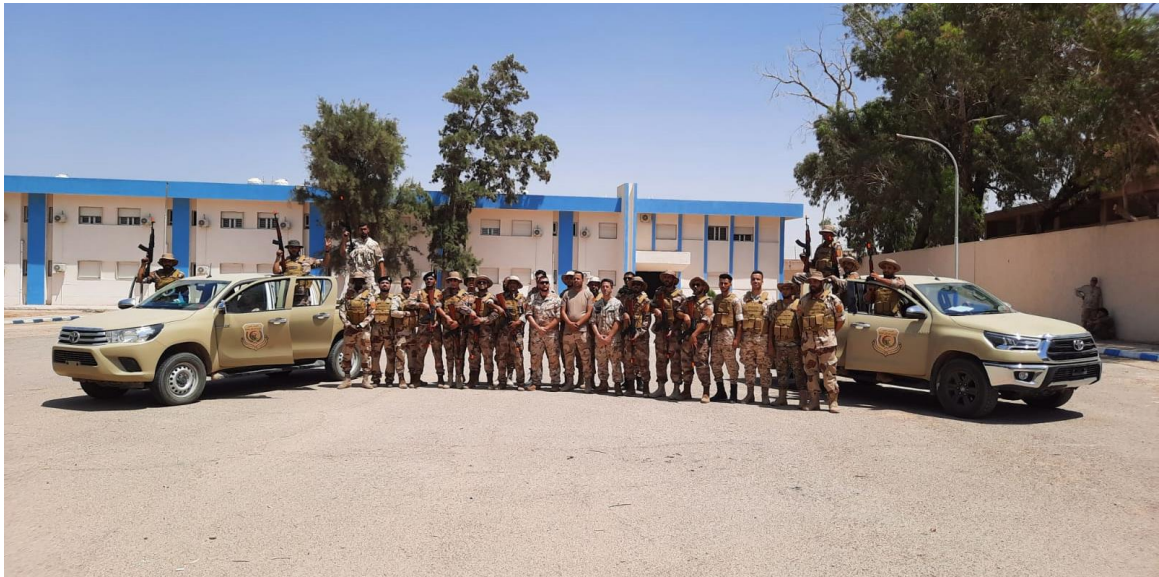
Fig. 7. Dal 10 al 20 luglio è stata svolto il corso “Conceptual Doctrinal Tools on Reconnaissance and Patrol Activities Training, a cura di un MTT della Scuola di Cavalleria a favore di n. 29 militari della Border Guard. TRIPOLI, JUL23.