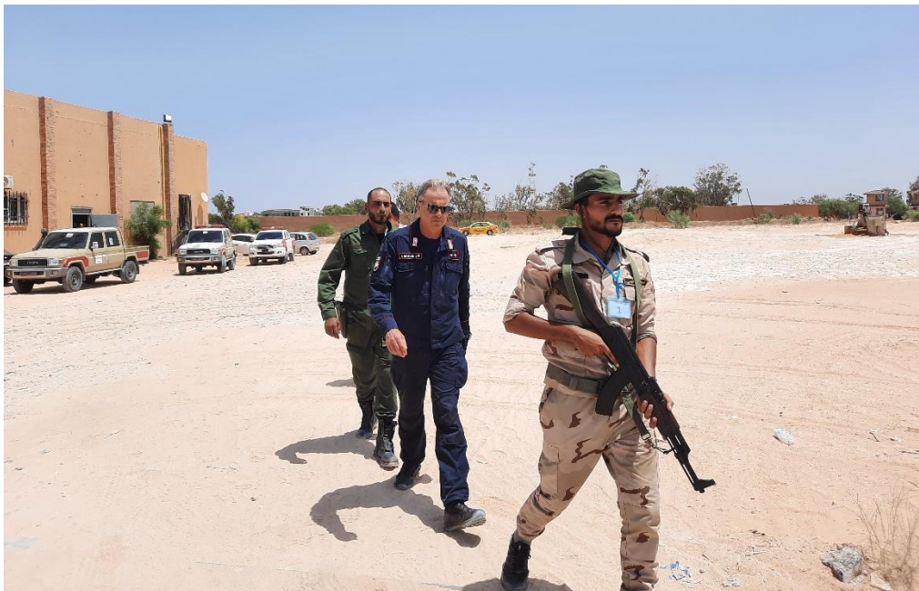
Fig.4. In risposta alla specifica richiesta formulata dal CHOT durante i lavori del CMC di giugno, l'MTT CC è stato incaricato di avviare un "VIP Military Escort Planning – Basic" a favore di 12 operatori della Libyan Military Police presso il Centro Addestramento MP di TRIPOLI. TRIPOLI, JUL23.