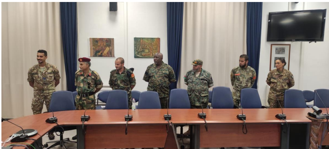
Fig. 1. Tra le attività formative svolte in ITALIA, dal 4 al 28 luglio è stato erogato il corso “Humanitarian Demining and mine clearance”, tenuto presso il Centro di Eccellenza C-IED di ROMA, a favore di 5 militari appartenenti al Libyan Military Engineering Department. ROMA, 28JUL23.