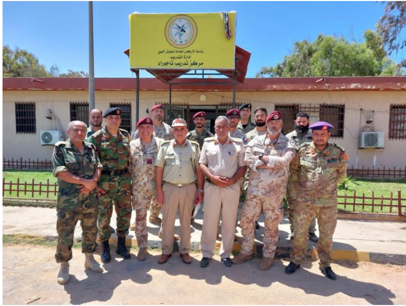
Fig. 3. La survey della delegazione del CAPAR giunta in T.O. per visitare le possibili aree individuate per la costituzione di un Centro di Paracadutismo in LIBIA e fornire le necessarie valutazioni di fattibilità/opportunità alla controparte, ha integrato e completato un'attività simile condotta a giugno da una paritetica delegazione libica inviata in ITALIA per acquisire gli elementi di conoscenza di base dell'organizzazione/struttura, funzioni, componenti del CAPAR.. TRIPOLI JUL23.