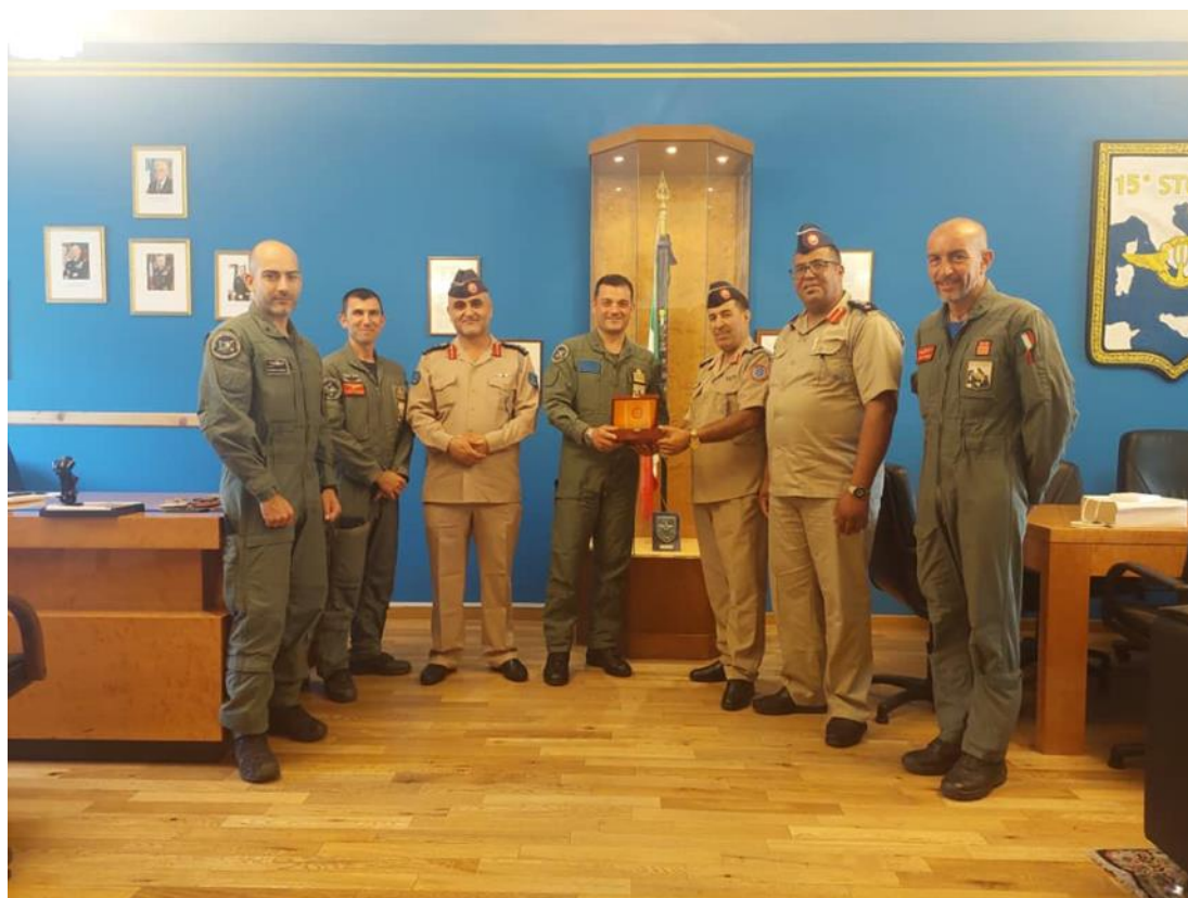
Fig. 2. Dal 9 al 15 luglio, 3 Ufficiali del Libyan Air Force hanno partecipato in qualità di osservatori al “corso di sopravvivenza in mare Basico” erogato da istruttori del 15° Stormo di CERVIA a favore di personale di volo dell’AMI. CERVIA, 15JUL23.