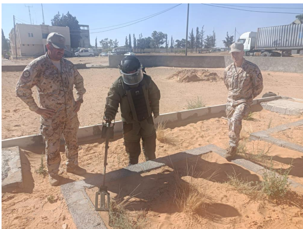
Figg. 5 e 6 Le attività del MTT del Genio sono caratterizzate da anni dalla costanza nell'erogazione dei corsi e la consolidata e apprezzata validità dell'offerta formativa. La presenza stabile dell'MTT in T.O. rappresenta un'importante e consolidata forma di cooperazione in uno dei settori dove si sente maggiormente la pressione di altri competitor internazionali interessati ad accaparrarsi la soddisfazione di una "quota" delle esigenze della controparte. Inoltre la ciclica riproduzione degli step dell'iter formativo per il training e l'aggiornamento della componente del LYME consente all'ITALIA di mantenere il primato nel settore. TRIPOLI, JUL23.