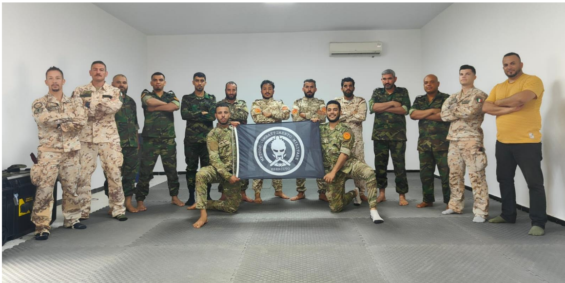
Fig.8. Gli istruttori MCM del Centro Addestramento di Paracadutismo di PISA con gli allievi della prima classe formata a favore delle Unità del Libyan Army della Regione Militare Centrale di MISURATA. Le attività di formazione, previste su più moduli, si prefiggono di poter arrivare a selezionare e qualificare un numero adeguato di istruttori per rendere le F.A. libiche indipendenti. MISURATA, JUL23.