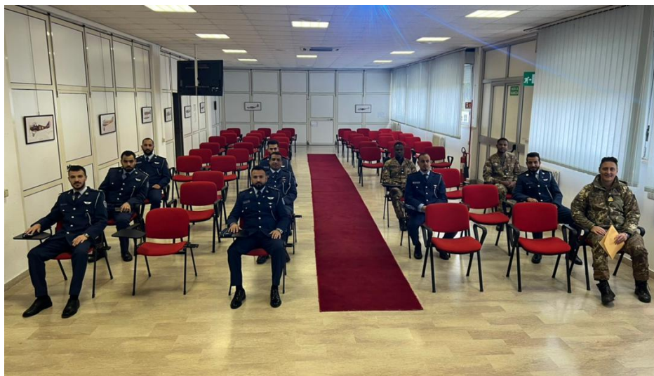
I frequentatori e istruttori del corso per il Controllo Aeroporto Strumentale.

Nel periodo si è concluso il “ Corso Basico Traffico Aereo – SMA 59 ” svolto presso il Reparto Addestramento Controllo Spazio Aereo di PRATICA DI MARE (R.A.C.S.A. – A.M.), dal 19 settembre al 2 dicembre a favore di n. 8 Ufficiali della Libyan Air Force . Tale corso, che si prefigge l’obiettivo di fornire le conoscenze fondamentali e le capacità pratiche relative alle procedure operative di base del Controllo del Traffico Aereo ed è propedeutico alla frequenza del corso “ Controllo Aeroporto Strumentale – SMA 59B ” avviato successivamente il 5 dicembre 2022 presso lo stesso Ente (termine previsto il 28 aprile 2023). Quest’ultimo ha lo scopo di fornire la preparazione necessaria ad accedere alla fase di tirocinio pratico per il conseguimento dell’abilitazione di controllo di aeroporto strumentale controllo di “torre” - ADI TWR.