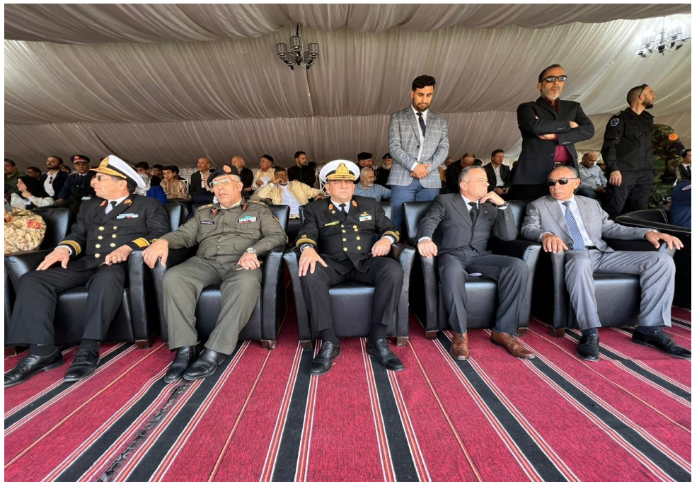
Il Comandante del DMM tra i dignitari presenti alla cerimonia del sesto anniversario della battaglia di AL BUNYAN AL-MARSOUS, tenuta presso la Piazza delle Palme a MISURATA. MISURATA, DEC22, FOTO MIASIT.